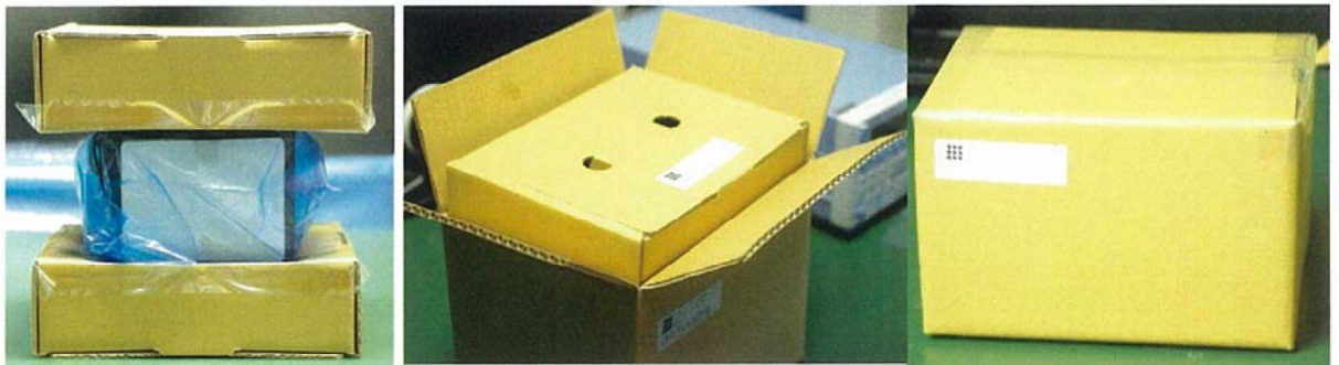
図3 大サイズ(縦幅 260mm×横幅 200mm×高さ 170mm or 縦幅 260mm×横幅 200mm×高さ 210mm)