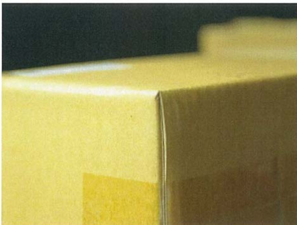
図4 個装箱の前面左下角（落下試験前）

凹みはあったが内容品が見えたり内容品が梱包からこぼれたりはしなかった 内容品の外観や機能に異常のないことを確認しました。