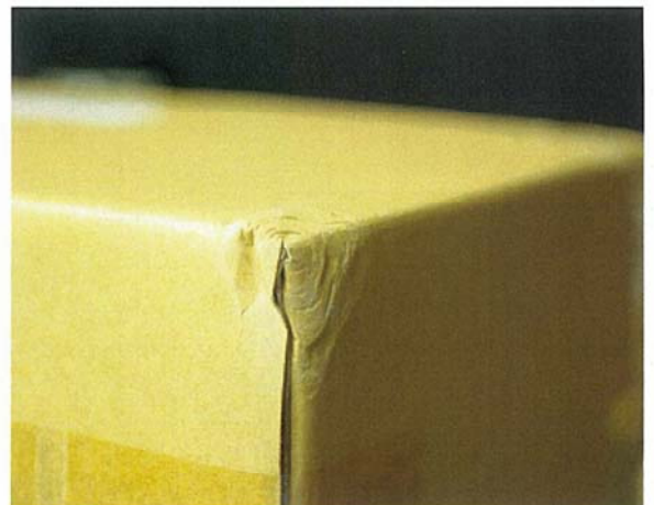
図5 個装箱の前面左下角（落下試験後）