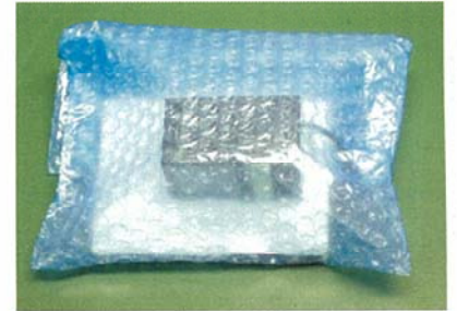
図1 従来の梱包方法